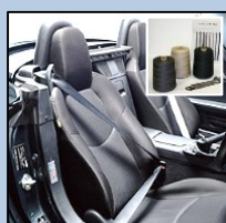
■座椅安全带 缝纫线